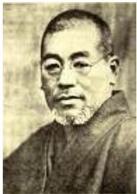
Dr. Mikao Usui

Reiki - die universelle Lebens- Energie, die durch die Hände des Reiki-Anwenders fließt, ist eine leicht zu erlernende Behandlungsmethode, - für sich oder andere angewandt - passt sich stets dem natürlichen Bedarf des Empfängers an und unterstützt erfolgreich jede Therapie. Reiki ist aber auch ein Transformationsweg zu dem sich das ICH entschliesst.